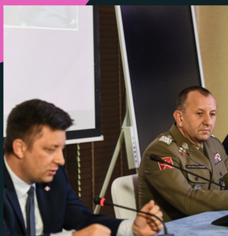
WSPÓŁPRACA PRZEMYSŁÓW ZBROJENIOWYCH POLSKI I UKRAINY