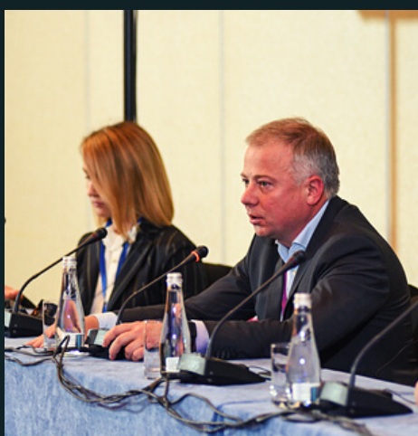
MIASTO I REGION: ODBUDOWA I ROZWÓJ