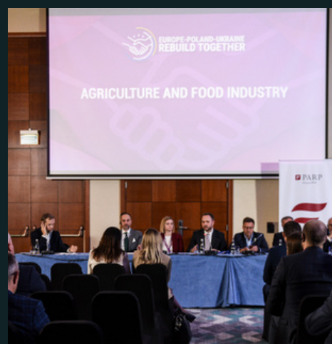
ROLNICTWO I PRZEMYSŁ SPOŻYWCZY