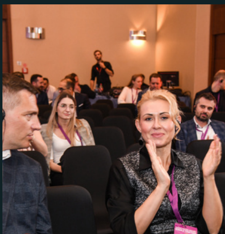
TRANSPORT I LOGISTYKA