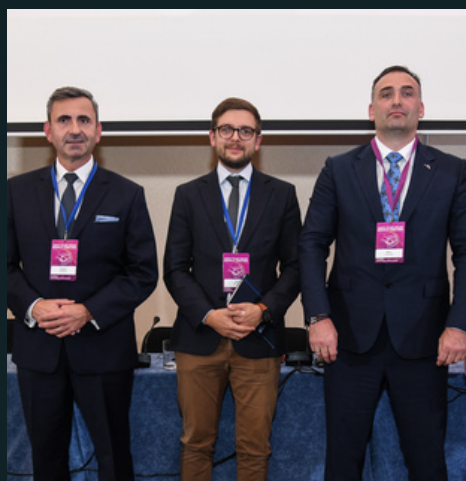
SEKTOR IT I NOWE TECHNOLOGIE