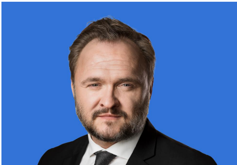
Zdjęcie 14 Dan Jørgensen (Dania), kandydat na komisarza ds. energii i mieszkalnictwa.

Bez wątplenia jedną z najciekawszych podjętych przez von der Leyen decyzji kadrowych jest ta dotycząca powołania Duńczyka Dana Jørgensena na komisarza ds. energii i mieszkalnictwa. To historyczne postanowienie, bowiem to pierwszy raz, kiedy organ wykonawczy UE w formalny sposób uznał kryzys związany z niedoborem przystępnych cenowo mieszkań. To problem doskonale znany i opisany w Polsce. Według Eurostatu aż 52,9% naszych rodaków w wieku od 25 do 34 lat mieszka z rodzicami. [18] Równocześnie dla 41% ankietowanych Polaków między 18 a 30 rokiem życia kupno mieszkania jawi się jako scenariusz zupełnie lub prawie niemożliwy. [19]