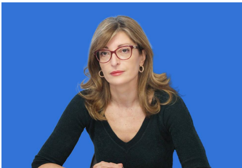
Zdjęcie 6 Ekaterina Zachariewa, kandydatka na komisarz ds. startupów, badań i innowacji.

Factory zapewniającą startupom AI dostęp do mocy obliczeniowej unijnych superkomputerów. Program ma w założeniu ułatwić szkolenie modeli AI i już dziś jest krytykowany za zbyt późne pojawienie się na radarze organu wykonawczego UE. Najbardziej perspektywiczne firmy AI z Europy już dawno nawiązały na wskazanej płaszczyźnie odpowiednie współpracy z amerykańskimi Big Techami, czego przykładem jest podpisana w lutym umowa pomiędzy francuskim jednorożcem Mistral a Microsoftem – zwracał ostatnio uwagę wpływowy portal POLITICO. [8] Co istotne dla biznesu, na polu legislacyjnym zakres obowiązków Virkkunen uzupełni przedstawienie propozycji Aktu o Chmurze UE i Rozwoju AI oraz odpowiedzialność za wdrożenie głośnych Aktu o Usługach Cyfrowych (DSA) i Aktu o Rynkach Cyfrowych (DMA) do krajowych porządków prawnych.