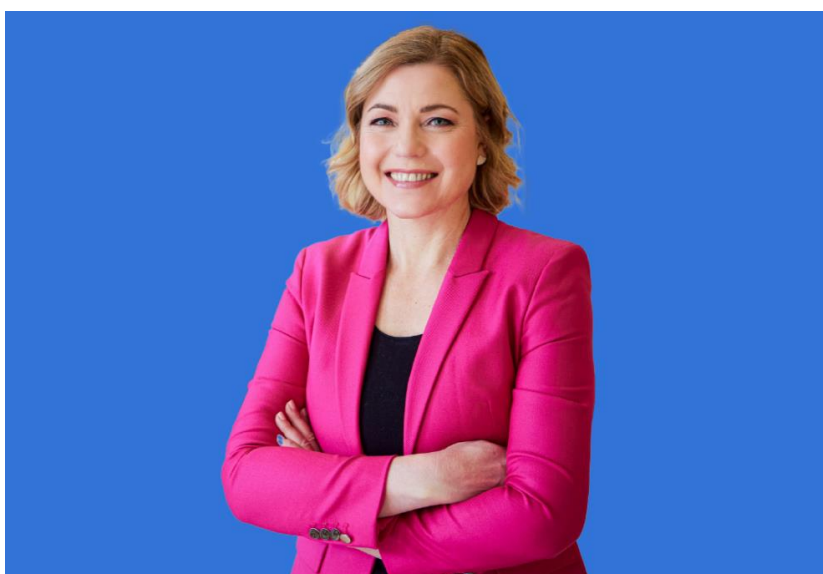
Zdjęcie 5 Henna Virkkunen, kandydatka na wiceprzewodniczącą wykonawczą KE ds. suwerenności technologicznej, bezpieczeństwa i demokracji.

Za odzwierciedlenie kursu nowej KE na konkurencyjność należy uznać również nominację fińskiej chadeczki Henny Virkkunen na wiceprzewodniczącą wykonawczą ds. suwerenności technologicznej, bezpieczeństwa i demokracji. Zgodnie z zapowiedziami Ursuli von der Leyen z lipca jednym z filarów tej funkcji będzie sprzyjanie rozprzestrzenianiu się technologii cyfrowych, co ma pociągnąć za sobą większą zdolność Europejczyków do wykorzystywania ich przy opracowywaniu nowych usług i modeli biznesowych. Osiągnięcie tego celu ma wspierać także strategia Apply AI, której przygotowanie jej zlecono. Ponadto polityczka będzie miała za zadanie uruchomić w ciągu pierwszych 100 dni swojego urzędowania inicjatywę AI