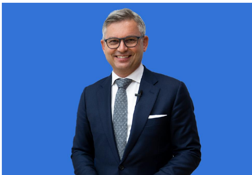
Zdjęcie 7 Magnus Brunner (Austria), kandydat na komisarza ds. wewnętrznych i migracji.

Znamienny wydaje się wybór austriackiego ministra finansów Magnusa Brunnera na komisarza ds. wewnętrznych i migracji. Jego kraj od lat sukcesywnie usztywnia swoje stanowisko względem migracji i swobodnego przepływu osób na terenie UE. Choć Wiedeń faktycznie wstawił się w ostatnim czasie takimi działaniami jak nielegalne