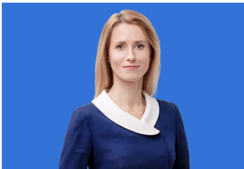
Zdjęcie 11 Kaja Kallas (Estonia), kandydatka na wiceprzewodniczącą KE i wysoką przedstawicielkę UE ds. polityki zagranicznej i bezpieczeństwa.

zadeklarowała przewodnicząca von der Leyen, jednym z jego zadań będzie przedstawienie w ciągu 100 dni urzędowania tzw. Białej Księgi o Przyszłości Europejskiego Przemysłu Obronnego. [13] Dokument wyłoży strategię stworzenia europejskiej tarczy powietrznej i systemu bezpieczeństwa cyberprzestrzeni oraz zdefiniuje potrzeby inwestycyjne służące zwiększeniu potencjału militarnego wspólnoty. Zarysuje też wizję sceptycznie odbieranych przez płatników netto wspólnych zakupów zbrojeniowych. Choć kandydat na komisarza nie bagatelizuje roli NATO, to jednocześnie podkreśla, że bez podjęcia wymienionych działań UE nie będzie gotowa na atak Rosji na jedno z Państw Członkowskich. [14] W tym kontekście Kubilius wzywa kraje europejskie do gromadzenia minimalnych zapasów amunicji. [15] Ów apel wydaje się być spójny z nominacją znanej z jastrzębiego stanowiska względem Moskwy byłej estońskiej premier Kai Kallas na wysoką przedstawicielkę UE ds. polityki zagranicznej i bezpieczeństwa.