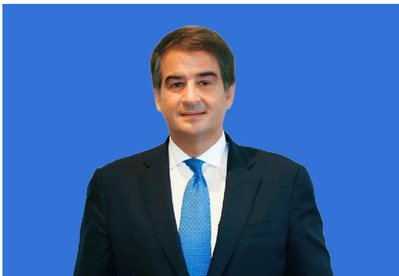
Zdjęcie 2 Raffaele Fitto (Włochy), kandydat na wiceprzewodniczącego wykonawczego ds. spójności i reform.

i reform. Były minister w rządzie Silvio Berlusconi to dziś stronnik premier Giorgii Meloni, której Bracia Włosi razem z Prawem i Sprawiedliwością tworzą frakcję Europejskich Konserwatystów i Reformatorów (EKR). Jego niepewne w obliczu sprzeciwu sił liberalnych i lewicowych powołanie stanowiłoby kolejny krok w kierunku odejścia od polityki „kordonu sanitarnego” stosowanej wobec niektórych ugrupowań „nowej europejskiej prawicy”. Miałoby jednak sens w kontekście zbliżonych stanowisk chadeków i EKR wobec części regulacji klimatycznych, w tym rozporządzenia ws. odbudowy zasobów przyrodniczych (ang. Nature Restoration Law ), przeciwko któremu zagłosowali w lutym eurodeputowani obu stronnictw. [4]