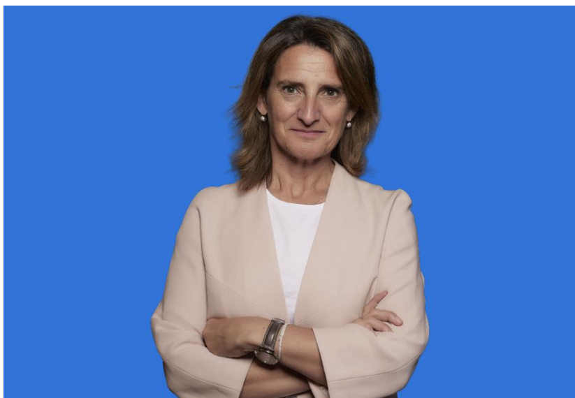
Zdjęcie 3 Teresa Ribera (Hiszpania), kandydatka na wiceprzewodniczącą wykonawczą KE ds. czystej, sprawiedliwej i konkurencyjnej transformacji.

Centralną postacią napędzającą inicjatywy na rzecz podniesienia konkurencyjności UE będzie Teresa Ribera, przyszła wiceprzewodnicząca wykonawcza KE ds. czystej, sprawiedliwej i konkurencyjnej transformacji. Hiszpańska socjalistka, dotychczasowa trzecia wicepremier oraz minister ds. transformacji ekologicznej i wyzwań demograficznych w rządzie Pedro Sáncheza, ma dopilnować, by blok pozostał na ścieżce ku redukcji emisji CO 2 do 2040 roku o 90% w porównaniu z rokiem 1990. Realizacji tego celu ma służyć zazielenianie przemysłu i tworzenie zachęt dla zrównoważonych inwestycji, w czym wesprze ją Holender Wopke Hoestra, przyszły komisarz ds. klimatu, zeroemisyjności i czystego wzrostu. Mając na uwadze dotychczasowe doświadczenie Ribery – byłej negocjatorki z ramienia ONZ i kluczowej