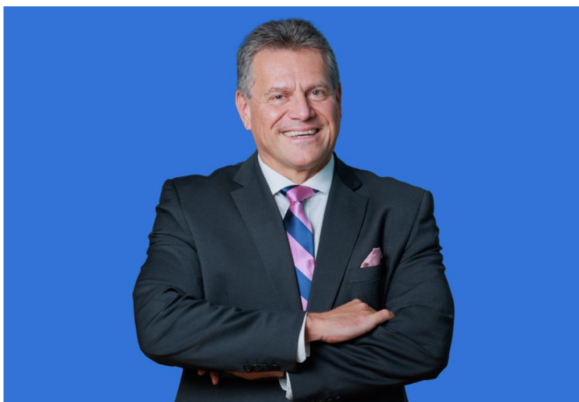
Zdjęcie 12 Maroš Šefčovič (Słowacja), kandydat na komisarza ds. handlu i bezpieczeństwa gospodarczego oraz stosunków międzyinstytucjonalnych i przejrzystości.

Projektując swój zespół na kolejne lata, Ursula von der Leyen zdecydowała się poświęcić szczególną uwagę nieuczciwej konkurencji ze strony chińskich podmiotów,