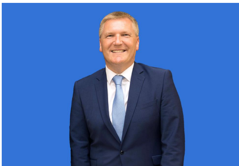
Zdjęcie 13 Michael McGrath (Irlandia), kandydat na komisarza ds. demokracji, sprawiedliwości i praworządności.

zwłaszcza platform e-commerce. Wśród obowiązków weterana Komisji Europejskiej Słowaka Maroša Šefčoviča, który znajdzie się w tym gremium już po raz czwarty, obejmując tę rolę komisarza ds. handlu i bezpieczeństwa gospodarczego oraz stosunków międzyinstytucjonalnych i przejrzystości, znalazły się m.in. zapewnienie z Państwem Środka “zrównoważonych relacji gospodarczych opartych na wzajemności” (tu w naturalny sposób przychodzi na myśl niedawny spór Brukseli i Pekinu o chińskie samochody elektryczne) czy sfinalizowanie wśród Państw Członkowskich negocjacji nad pakietem reform celnych (obecnie chińscy detaliści sprzedający online czerpią przewagę konkurencyjną np. z istnienia progu de minimis zwalniającego towary o wartości poniżej 150 EUR z obowiązku uiszczania cła). [16] Jego zadaniem będzie również ochrona jednolitego rynku przed napływem produktów niespełniających europejskich norm i standardów.