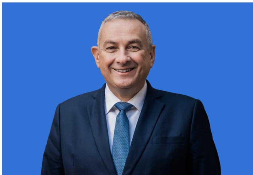
Zdjęcie 9 Jozef Síkela (Czechy), kandydat na komisarza ds. partnerstw międzynarodowych.