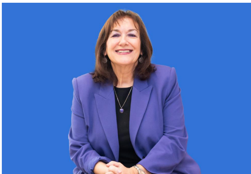
Zdjęcie 8 Dubravka Šuica (Chorwacja), kandydatka na komisarz ds. Morza Śródziemnego.

przedłużanie tymczasowych kontroli granicznych, rozpoczęcie budowy murów granicznych czy blokowanie rozszerzenia strefy Schengen o Rumunię i Bułgarię, to podobne inicjatywy coraz częściej wpisują się w główny nurt unijnej debaty. Dość wspomnieć, że także Niemcy zdecydowali w zeszłym miesiącu o przywróceniu kontroli na wszystkich swoich granicach lądowych. [10] Niedługo wcześniej przedstawicielka Berlina w Komisji Europejskiej Ursula von der Leyen wezwała do poszukiwania „innovacyjnych sposobów” na walkę z nielegalną migracją. [11] Jednym z nich ma być nawiązywanie szeroko zakrojonych partnerstw z krajami ościennymi, za co będą odpowiedzialni komisarz ds. Morza Śródziemnego Chorwatka Dubravka Šuica oraz czeski komisarz ds. partnerstw międzynarodowych Jozef Síkela. Inspirację dla ich przyszłych aktywności będzie najpewniej stanowić m.in. niedawna umowa pomiędzy Włochami a Albanią przewidująca odsyłanie przechwyconych na włoskich wodach terytorialnych migrantów do położonych w bałkańskim kraju specjalnych ośrodków trudniących się przetwarzaniem wniosków azylowych. [12] Można z dużym prawdopodobieństwem założyć, że tego rodzaju porozumienia staną się w kolejnych latach sankcjonowaną przez Komisję Europejską normą.